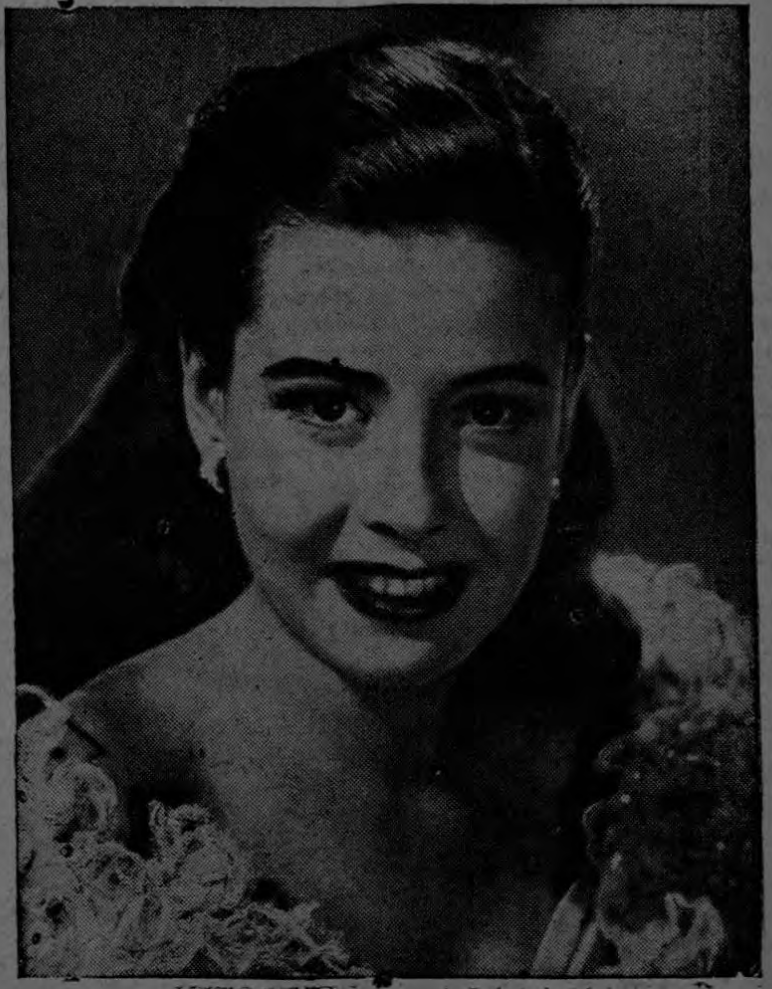
GLORIA DE HAVEN... actriz de la Metro Goldwyn Mayer.