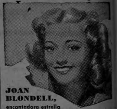
JOAN BLONDELL, encantadora estrella de Hollywood, dice: "Pink Queen es el rosa ideal".