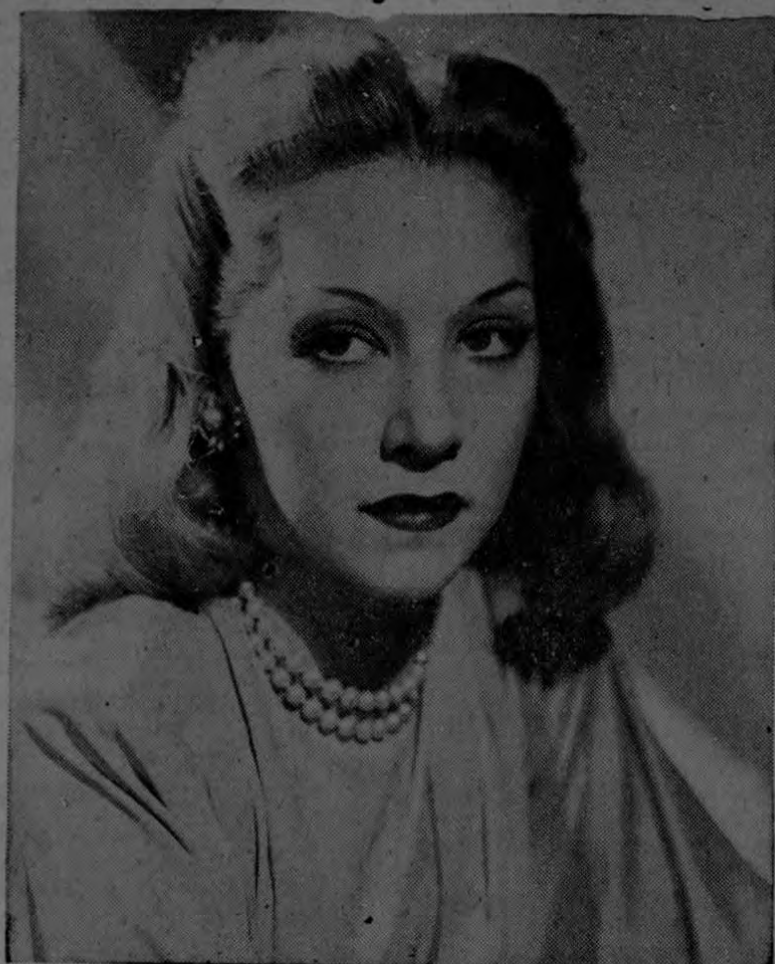
La perfección de un maquillaje como el que presenta en esta foto la adorable BELITA, estrella de Monogram, es el resultado de usar sólo materiales de belleza garantizados por el tiempo declara Max Factor Jr.

demonstrada y que no están respaldadas por una firma acreditada, es una medida muy recomendable siempre, sobre todo para las mujeres que no pueden desperdiciar el dinero en productos innecesarios o sin valor práctico alguno.